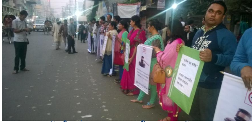
তামাকবিরোধী সংগঠনসমূহের মানববন্ধন, জাতীয় প্রেসক্লাব, ০৬ ডিসেম্বর ২০১৫

প্রজ্ঞার মাসিক ই-নিউজলেটারের মাধ্যমেও এই প্রতিযোগিতা আয়োজনের খবরাখবর সকলের সামনে তুলে ধরা হয়েছে।