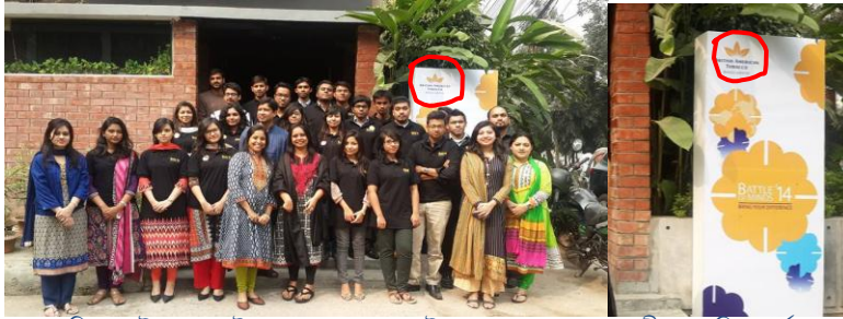
বিএটিবি'র লোগো সম্বলিত ব্যাটল অব মাইন্ডস ২০১৪ এর পোস্টারের সাথে অংশগ্রহণকারীদের ছবি, জর্জেস ক্যাফে রেস্তুরেন্ট।

তামাক নিয়ন্ত্রণ আইনকে অগ্রাহ্য করে প্রতি বছরের ন্যায় ২০১৪ সালেও ব্যাটল অব মাইন্ডস প্রতিযোগিতায় অংশগ্রহণের জন্য আবেদন প্রকাশ করে। চাকুরি খোঁজার ওয়েবসাইট bdjobs.com আবেদন প্রকাশের পাশাপাশি বিএটিবি ঢাকা বিশ্ববিদ্যালয়ের আইবিএ অডিটোরিয়ামে 'ব্যাটল অব মাইন্ডস ২০১৪' প্রতিযোগিতার আনুষ্ঠানিক উদ্বোধন ঘোষণা প্রদানের মাধ্যমে "Are you next in the Legacy of Leaders? শিরোনামে বিভিন্ন বিশ্ববিদ্যালয়ে রোডশো শুরু করে। বিভিন্ন পোস্টার ব্যানাওে সজ্জিত রোডশোগুলোতে মূলত কোম্পানির প্রচার প্রচারণা চলতে থাকে।