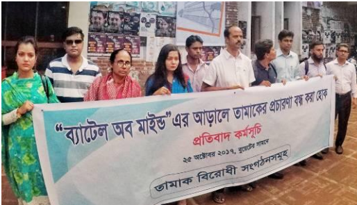
রোড শো বন্ধের দাবিতে বুয়েটে মানববন্ধন কর্মসূচি, ২৫ অক্টোবর ২০১৭

প্রজ্ঞার টোব্যাকোইন্ডাস্ট্রিওয়াচবিডি টিম তরুণদের সুরক্ষায় বিএটিবির অবৈধ প্রতিযোগিতা বন্ধের দাবি জানিয়ে একটি এলাট ইমেইল এবং সোশ্যাল মিডিয়ার মাধ্যমে সকলকে জানিয়ে দেয়। পরবর্তীতে তামাকবিরোধী সংগঠনসমূহের এক সমন্বিত প্রয়াস এবং দাবির মুখে বাংলাদেশ প্রকৌশল বিশ্ববিদ্যালয়ে বিএটিবি আয়োজিত রোডশো বাতিল ঘোষণা করে বিশ্ববিদ্যালয় কর্তৃপক্ষ। গণমাধ্যমেও এবিষয়ে বেশকিছু সংবাদ প্রকাশিত হয়।