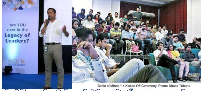
বিএটিবি'র এম ডি আই বি এ অডিটোরিয়ামে শিক্ষার্থীদের সামনে বক্তব্য দিচ্ছেন।

তামাক নিয়ন্ত্রণ আইনকে অগ্রাহ্য করে প্রতি বছরের ন্যায় ২০১৪ সালেও ব্যাটল অব মাইন্ডস প্রতিযোগিতায় অংশগ্রহণের জন্য আবেদন প্রকাশ করে। চাকুরি খোঁজার ওয়েবসাইট bdjobs.com আবেদন প্রকাশের পাশাপাশি বিএটিবি ঢাকা বিশ্ববিদ্যালয়ের আইবিএ অডিটোরিয়ামে 'ব্যাটল অব মাইন্ডস ২০১৪' প্রতিযোগিতার আনুষ্ঠানিক উদ্বোধন ঘোষণা প্রদানের মাধ্যমে "Are you next in the Legacy of Leaders? শিরোনামে বিভিন্ন বিশ্ববিদ্যালয়ে রোডশো শুরু করে। বিভিন্ন পোস্টার ব্যানাওে সজ্জিত রোডশোগুলোতে মূলত কোম্পানির প্রচার প্রচারণা চলতে থাকে।