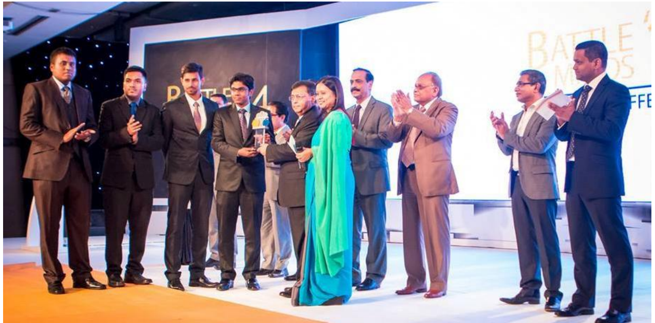
‘ব্যাটল অব মাইন্ডস ২০১৪’ এর গ্র্যান্ড ফিনালে অনুষ্ঠানে বিজয়ীদের পুরস্কার প্রদান