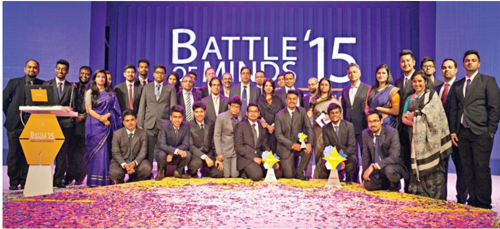
'ব্যাটল অব মাইন্ডস ২০১৫' এর গ্র্যান্ড ফিনালে অনুষ্ঠানে বিজয়ীদের পুরস্কার প্রদান

কর্মকর্তাদের পাশাপাশি গণমাধ্যম এবং ব্যবসায়ী সমিতির নেতৃবৃন্দকেও এই অবৈধ প্রতিযোগিতার পুরস্কার প্রদান অনুষ্ঠানে উপস্থিত থাকতে দেখা যায়।